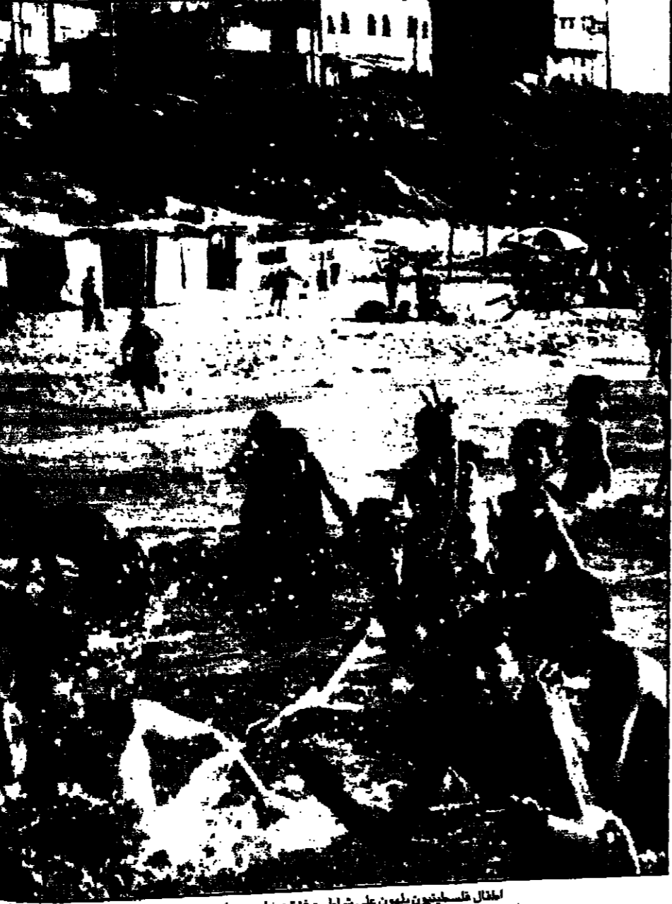
أطفال فلسطينيون يمشون على شاطئ غزة من حين حفره البحر

بيروت - من عصام حمزة: تفضح الانتخابات المحلية في لبنان اجسام القوى السياسية. وقال مسؤولون في القوى السياسية ان الانتخابات ستعطي صورة واضحة عن الوضع في لبنان. وذكر ان الانتخابات ستعطي صورة واضحة عن الوضع في لبنان.